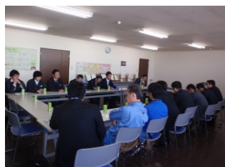
定例会時様子 (九州製紙北九州工場内)

2014年4月、九州製紙株式会社北九州工場の視察見学をおこなった。また、ミーティングルームを貸していただき紙藍会定例会も同日同場所にておこなった。トイレットペーパー等の家庭紙製品が原料の古紙類からどのように製造されているかといった一連の工程を順に見学ができ、大変良い勉強となった。