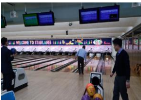
ボウリング大会様子

2017年1月、紙藍会においてダーツ大会が開催された。今回2回目の開催となり、各員前回以上の盛り上がりの中終了となった。